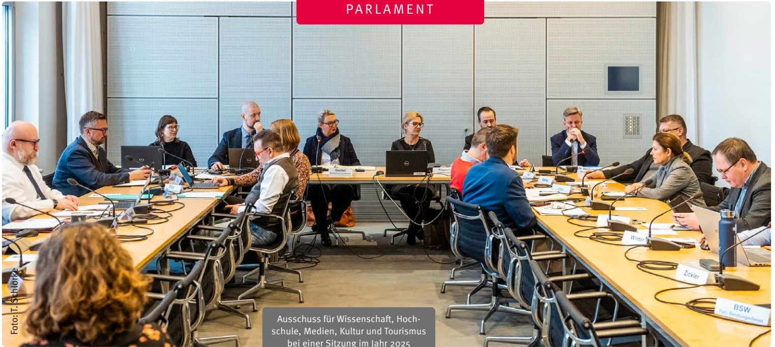
Ausschuss für Wissenschaft, Hochschule, Medien, Kultur und Tourismus bei einer Sitzung im Jahr 2025