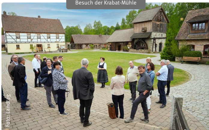
Besuch der Krabat-Mühle