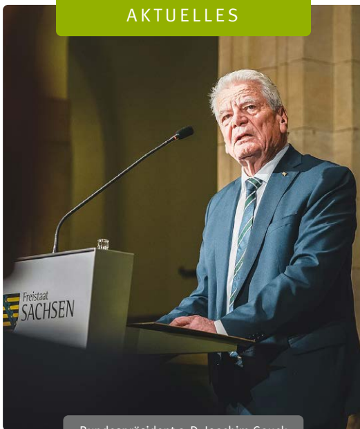
Bundespräsident a. D. Joachim Gauck