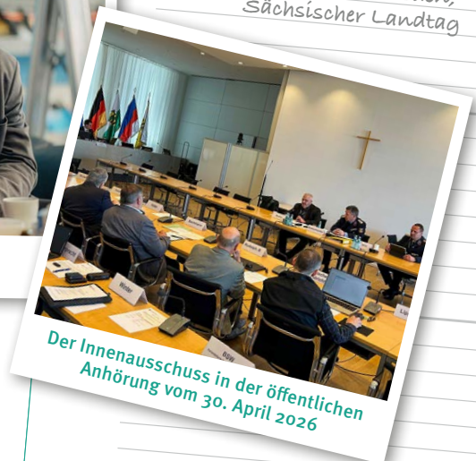
Der Innenausschuss in der öffentlichen Anhörung vom 30. April 2026