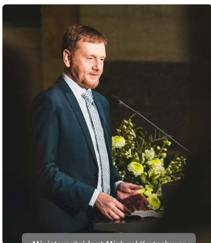
Ministerpräsident Michael Kretschmer